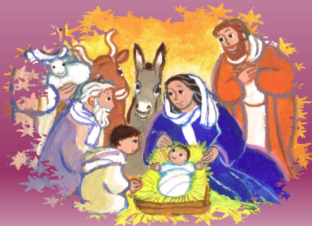
Illustration de Maïte ROCHE avec l'aimable autorisation des éditions MAME